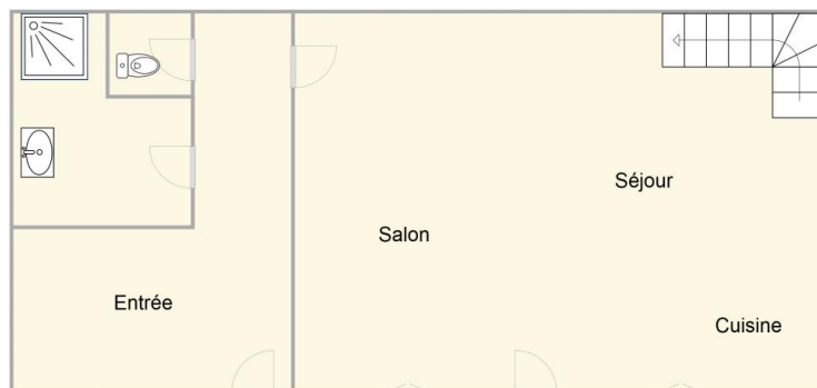
Rez de chaussée