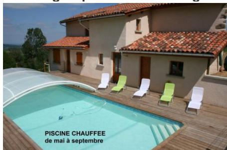
PISCINE CHAUFFEE de mai à septembre

Gîte de groupe situé en Auvergne-Rhône-Alpes au centre de la France.